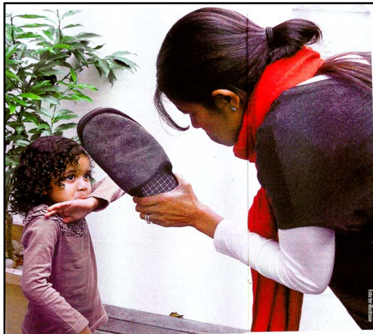
[Uit Kuier , 25 Mei 2011]